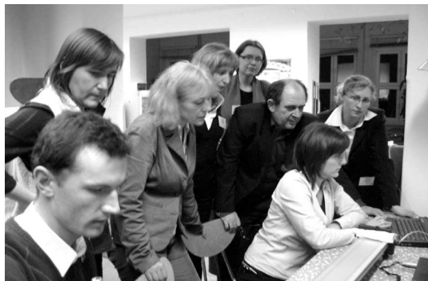
Fot. 2. W Seminarium toruńskim wzięło udział 60 uczestników. Jedynym ograniczeniem była liczba stanowisk pomiarowych. Stanowisko z mechaniki, wymagające współdziałania kilku „uczniów”, cieszyło się szczególnym zainteresowaniem.

Do udziału w seminarium zaprosiliśmy nauczycieli, doradców metodycznych, naukowców fizyków, dydaktyków-pedagogów, elektroników-automatyków, przedstawicieli firm handlowych, studentów. Pięć dni wymiany opinii i warsztatów spotkały się z bardzo pozytywnym przyjęciem wszystkich słuchaczy. Nauczyciele mieli możliwość nie tylko posłuchania wykładów, ale przede wszystkim samodzielnego wypróbowania wszystkich udanych i nieudanych wariantów doświadczeń.