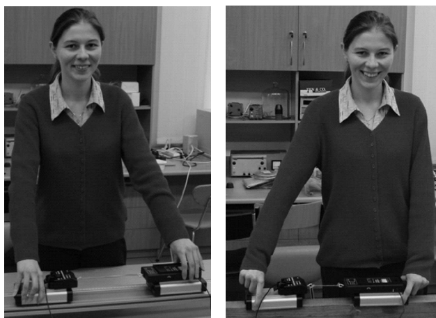
Rys. 1. Dwa wózki z podłączonymi czujnikami siły: a) połączone gumką – doświadczenie statyczne (z lewej); b) połączone sznurkiem, ciągnięte po drewnianej belce – doświadczenie dynamiczne (z prawej).

Doświadczenie wykonywane za pomocą zestawu PASCO, z gotową lekcją załadowaną przez software wymaga włączenia Xplorera GLX (lub konsoli 750) oraz uruchomienia pliku „tug of war”. Wówczas na ekranie komputera wyświetli się wykres zależności siły od czasu dla obu czujników (na jednym wykresie). Częstotliwość próbkowania jest ustawiona na 20 Hz. Czujniki trzeba podłączyć do dwóch portów konsoli. Jeden z czujników odbiera sygnał dodatni, gdy wózek jest popchnięty bądź szarpnięty, a drugi czujnik odbiera sygnał ujemny, gdy drugi wózek jest pchnięty lub szarpnięty. Następnie należy ustawić tor i go wypoziomować, postawić wózki i zamocować czujniki sił. Trzeba pamiętać o ich wyzerowaniu.