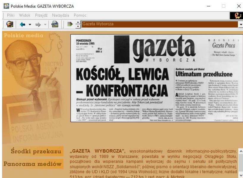
Rys. 5. Galeria „Polskie media”.