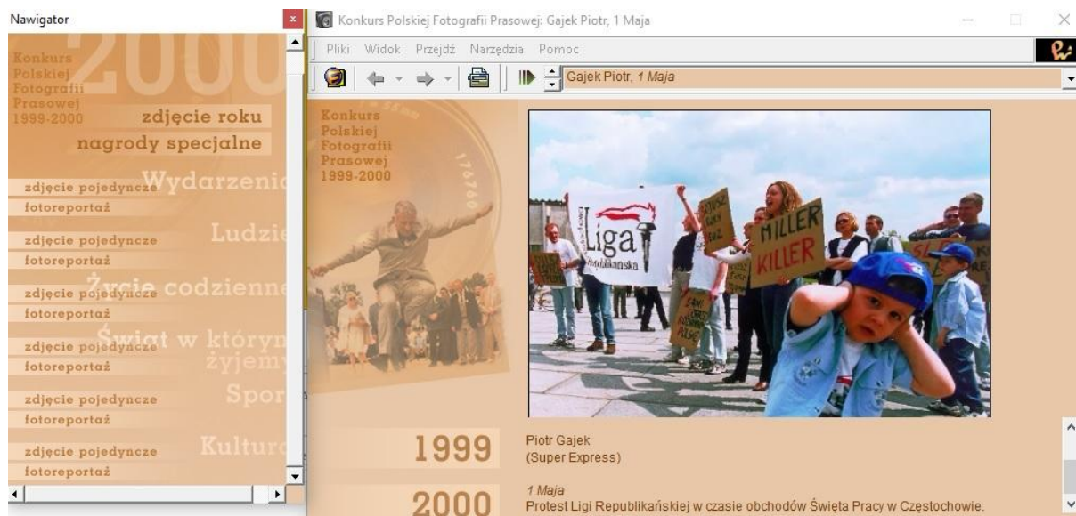
Rys. 6. Galeria „Konkurs Polskiej Fotografii Prasowej”