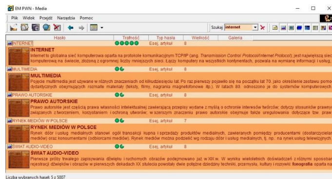
Rys. 2. Zdjęcia dostępne dla hasła „internet”.

Po uruchomieniu programu mamy możliwość wyszukiwania interesującego nas hasła (powyżej przykład dla terminu „internet”) i jego wyjaśnienia. Domyślnie aktywne są wszystkie ustawienia wyszukiwania (ikonki w prawej części paska zadań: teksty, esej, artykuł, zdjęcia, filmy, nagrania, tabele), możemy jednak bardzo łatwo ograniczyć wyniki wyszukiwania, odznaczając niepotrzebne opcje. Poniżej – dla tego samego terminu „internet” pozostawiono zdjęcia (sprawdź samodzielnie, jak działa ten system, uzyskując taki układ ekranu).