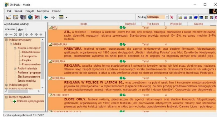
Rys. 3. Wyniki wyszukiwania zaawansowanego.

Ikony po lewej otwierają galerie – dodatkowe okna zawierające: panoramę mediów, polskie media, konkurs polskiej fotografii prasowej. Wybierz panoramę mediów.