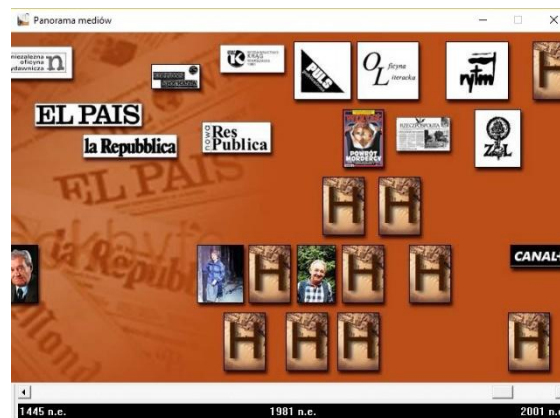
Rys. 4. Panorama mediów.

Ikony po lewej otwierają galerie – dodatkowe okna zawierające: panoramę mediów, polskie media, konkurs polskiej fotografii prasowej. Wybierz panoramę mediów.