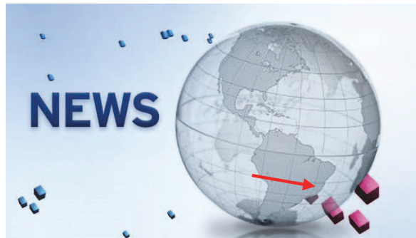
Ryc. 4.1. Obraz kręcącej się Ziemi jest czołówką wielu dzienników TV – tu przykład włoski i niemiecki

Inaczej jest w Australii – tam też słońce wschodzi na wschodzie i zachodzi na zachodzie, ale w samo południe jest dokładnie na północy . Trudno się temu dziwić: Słońce świeci (20.03 i 22.09) pionowo nad równikiem a dla Australii równik jest na północy. W konsekwencji, zegary słoneczne w Australii mają rosnący porządek godzin w odwrotnym kierunku niż zegary w Europie.