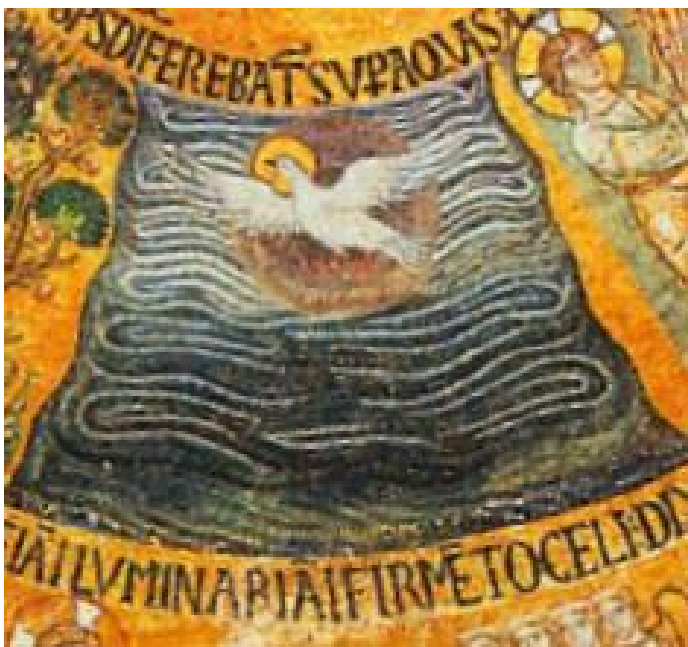
Ryc. 8.1. Nieznany autor mozaik katedry św. Marka w Wenecji (XIII wiek) bardzo dobrze rozumiał znaczenie wersetów 1-2 Księgi Rodzaju: nieskończone fale wstrząsają otchłanią - ani morzem, ani ziemią - a Duch Święty unosi się nad nimi.

Opis pierwotnej materii – melasy najcięższych kwarków ( top i bottom ), z których świat przypuszczalnie składał się w ciągu pierwszych 10^{-12} sekund (co więcej: nie wykluczając, jeszcze bardziej egzotycznych cząstek) – jako "bezkształtnej i pustej masy" jest nie mniej precyzyjny niż dywagacje naukowe; a przede wszystkim znacznie łatwiejszy do zrozumienia , do dziś.