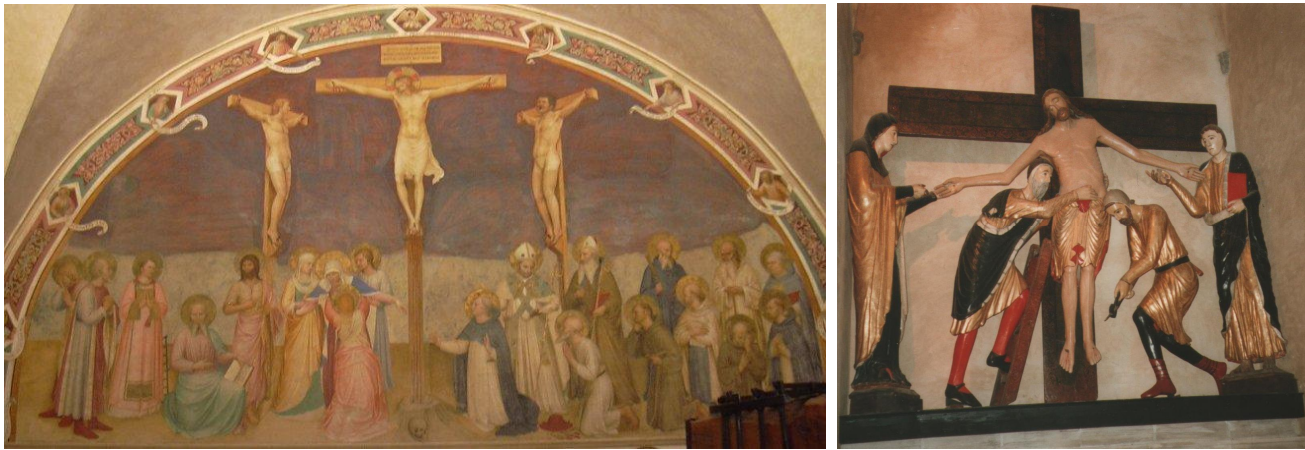
Ryc. 7.6. Przyjście Chrystusa, o którym opowiada Prolog Ewangelii św. Marka (i pierwszy list św. Pawła do Koryntian), jest łukiem między Stworzeniem a Odkupieniem. Tu pokazujemy Człowieka, który przyszedł, aby wybawić człowieka od grzechu pierworodnego - w przedstawieniach w klasztorze San Marco we Florencji (Fra Angelico, 1442) i w katedrze Santa Maria Assunta w Volterze (rzeźba drewniana, autor nieznany, 1228).

Albert Einstein wyraził to podobnie: "Delikatny jest Pan".