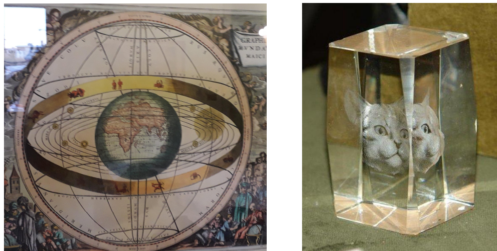
Fig. 7.1. Dwa obrazy, aby podkreślić, że nawet "dokładne" nauki podlegają ludzkiej interpretacji. (a) System Tycho Brahe, zmieszany między ptolemejskim i kopernikańskim: błędny, ale dobrze odtwarzał pozorne ruchy planet. (b) Kot Schrödingera jest trochę z profilu, trochę en face : w fizyce kwantowej pomiar składa się z "projekcji" stanu właściwego układu, nieznanego, z zdeteterminowanym operatorem matematycznym wybranym dla pomiaru.

3) Czy nauki ścisłe opierają się na obiektywnych danych, a nauki humanistyczne na sądach? Powyżej omówiliśmy, że dane wymagają interpretacji, ale jest coś więcej: nauki ścisłe zawsze szukają wsparcia w osądach innych naukowców, czyli w opiniach. Innymi słowy, nauki przyrodnicze również proszą o dane humanistyczne.