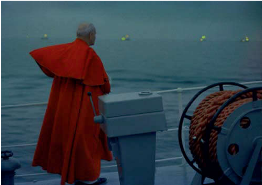
Ryc. 9.5. Św. Jan Paweł II w czasie rejsu po Zatoce Gdańskiej (11 VI 1987).